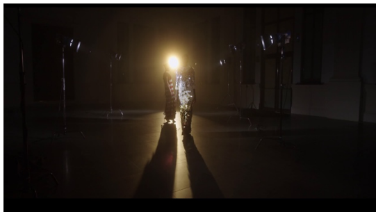
Frame, Paco Rabanne. Una vida fuera del patrón (Paco Rabanne. Una vita fuori dagli schemi), di Pepa Ramos, 2024